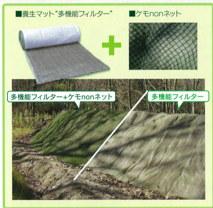
多機能フィルター+ケモnonネット