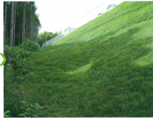
施工 3 ヶ月後