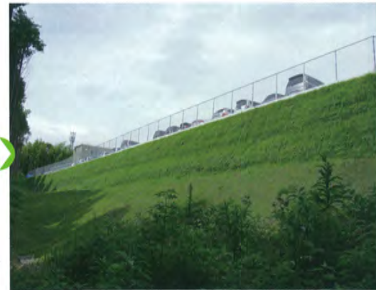
施工 3 ヶ月後