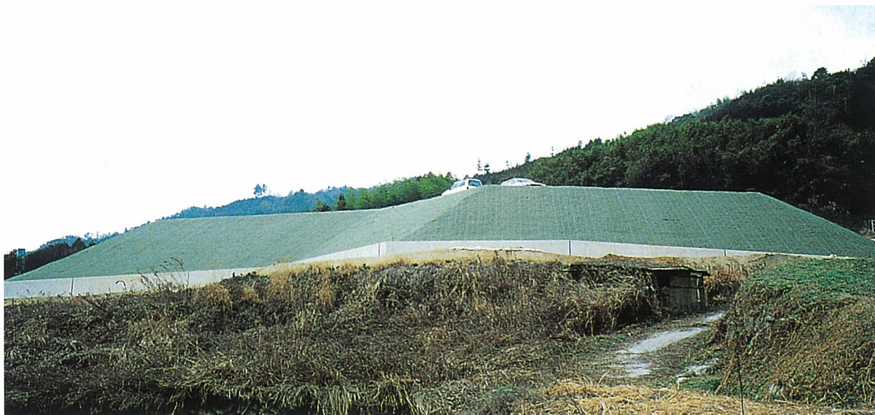
自然植生導入の基盤整備

多機能フィルター SP-45(厚さ約10mm)、SP-30(厚さ約6mm)はウェブと呼ばれる不織布とその補強ネットからなる製品です。土壌侵食防止、濁水防止、自然植生導入の基盤整備等の目的に使用します。また種子、肥料等の緑化材を装着していませんので吹付工との併用により、吹付材の流亡を防止し、安定した緑化が可能になります。