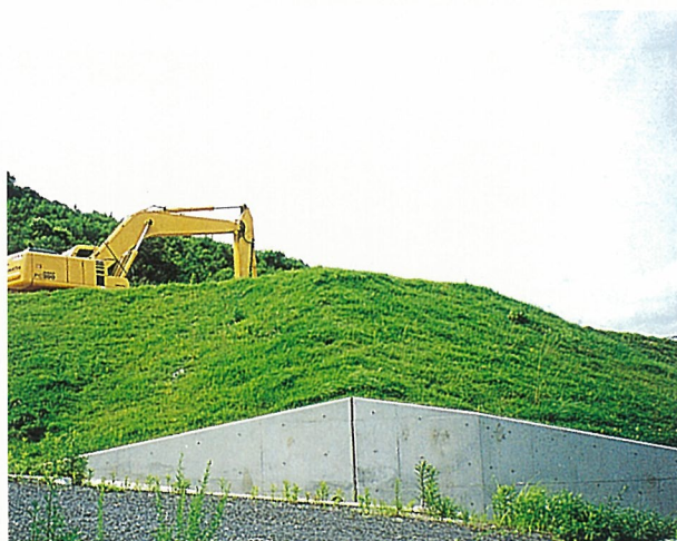
吹付併用工（種子吹付の上からSP-30で被覆）